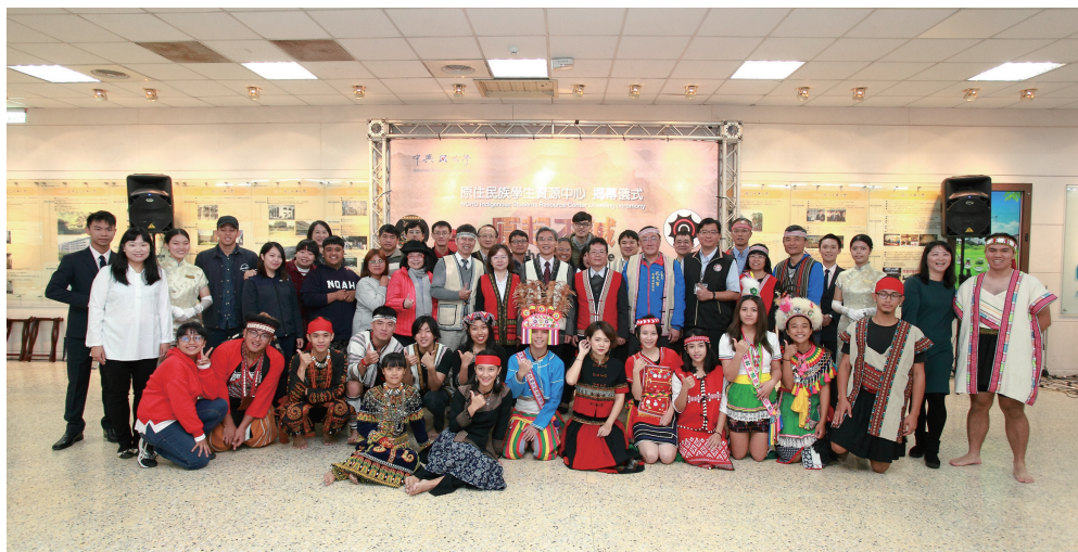
2017年中興大學原資中心揭牌。

數位走讀原民史、(3)族語線上資源應用、(4)心理韌性與職涯探索。這些活動不僅提升承辦人文化知能，也使原民學生能在文化理解與自我認同上獲得支持。在校園推廣方面，114年舉辦之中區聯合成果展與全民原教週活動，單場觸及人次達 250 至 400 人以上，透過市集、論壇與展演，讓原住民族教育成為全校師生可參與的公共議題。