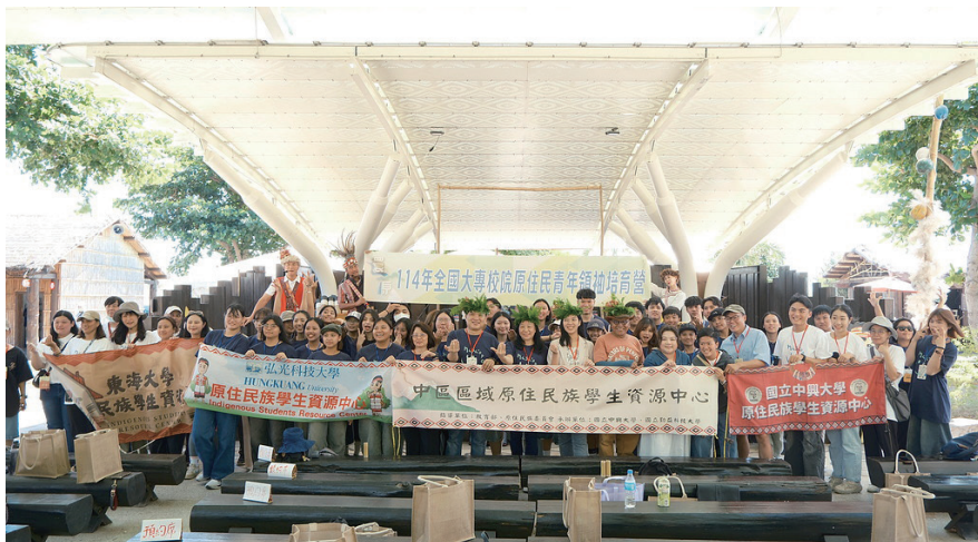
2025年10月赴台東縣舉辦全國原住民族青年領袖培育營。