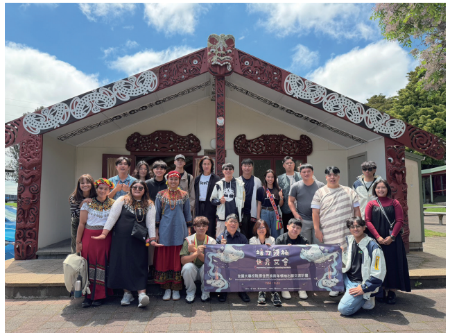
2025年11月14至紐西蘭懷卡托大學毛利族傳統建築參訪，並與當地學生及組織交流。

在這些推動過程中，我們最常聽到學生說的一句話是：「原資中心讓我覺得不孤單。」對離鄉求學的學子而言，一個可以被理解、被支持的空間非常重要。從活動參與者到活動策劃者、從文化學習者到公共議題倡議者，許多學生在原資中心的陪伴下逐漸成長。然而，100%設置之後，挑戰仍然存在。包括經費穩定性、人力流動率、行政負擔增加，以及如何在制度化過程中保持文化