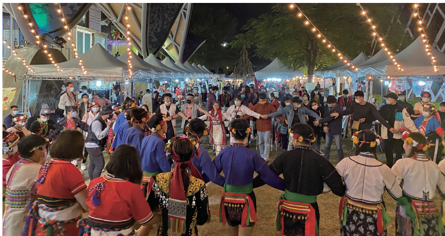
2021年在台東鐵花村辦理聯合成果展，利用知名景點人潮眾多的地方，宣傳全民原教之理念。

透過連續舉辦四年的經驗，我們看到區域夥伴之間的默契逐漸加深。不同學校的學生開始主動合作，甚至在活動之外持續聯繫。成果展同時也吸引一般民眾參與，讓全民原教的理念在更大的社會場域中被看見。