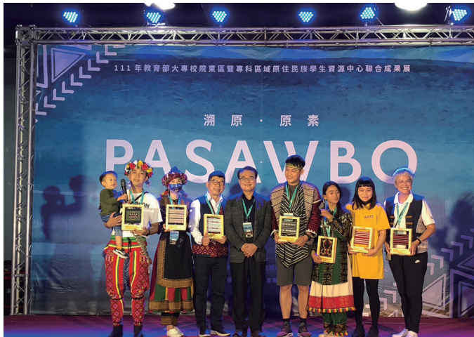
2022年東區原資中心合成果展中，頒發區域內夥伴學校久任人員服務獎。

住民族教育研討會與海外參訪，讓學生走出台灣，看見不同國家的原住民族處境與教育模式。