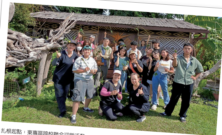
扎根起點：東專區跨校聯合迎新活動。

座落於花蓮縣壽豐鄉，擁有全國首座「原住民族學院」，是東台灣原住民族教育的文化根基。在全國大學原資中心設置率達成 100% 的里程碑時刻，東華大學原資中心的角色已從「單校服務」轉型為「區域領航」。身為東專區區域原資中心的專任助理，我每天的工作不僅是行政庶務，更是在編織一張連結 17 所夥伴學校的支援網絡。我們深知，對於原民學生而言，原資中心不應只是地圖上的一個處室，而是一個「家的延伸」。本文將分享東華大學如何立基於深厚的文化根基與學術資源，發揮區域中心的橋樑作用，積極投入跨校原民課程的籌備與試辦，讓東區的原民青