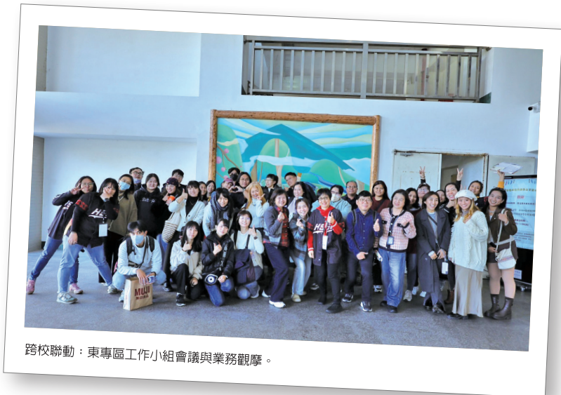
跨校聯動：東專區工作小組會議與業務觀摩。

的困境往往需要校內更高層級的支持。透過區域中心的介入與專業建議，能促使夥伴學校行政端更重視原民生的需求。同時，我們也積極分享「久任人員獎勵機制」等穩定人力的具體經驗，協助各校留住優秀人才。