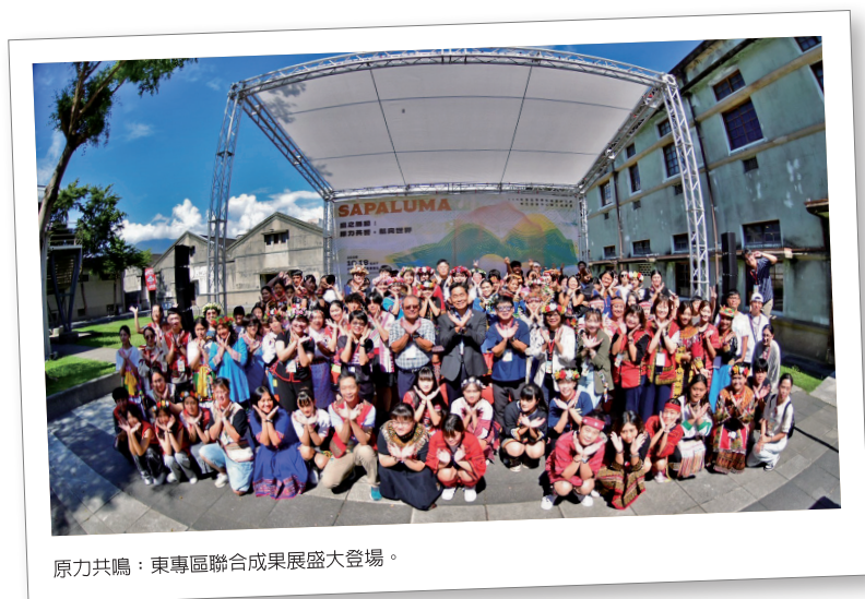
原力共鳴：東專區聯合成果展盛大登場。

耕多年，現已將原資中心納入正式行政編制，隸屬學生事務處。這種「正式化」地位象徵服務能量的穩定，讓我們從校內輔導窗口，蛻變為引領東專區 17 所夥伴學校共好的區域核心。