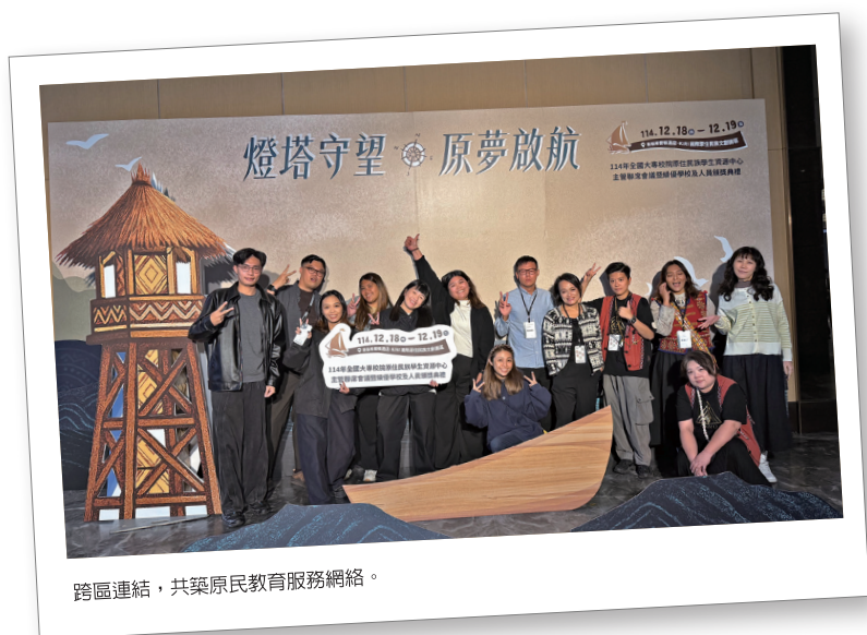
跨區連結，共築原民教育服務網絡。

民學子，從互不相識到最後手牽著手、圍成圓圈傳唱著原民古謠，那純粹的歌聲總會讓我紅了眼眶。