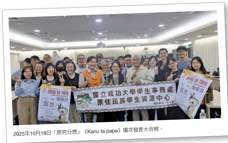
2025年10月18日「原究分想」《Kanu ta papa》場次發表大合照。

徵求稿件，投稿資格包含專業研究者及學生，投稿者只需提供大綱審查。經審查通過者，將由原資中心邀請出席發表，並提供交通費與出席費。以第一屆為例，係以全民原教、校園隱微歧視與傳統知識研究為主題，共收到24篇稿件，最後審查通過12篇稿件。報告人包含成大及成大以外之校院教師與研究員乃至高中生。綜合討論中，更是啟發多面向的討論，精采十分，計有50人參與；第二屆更進一步與台灣原住民醫學學會跨域協力舉辦，並預計成為固定舉辦模式。除此之外，成大原資中心與全民原教相關之活動尚有：Podcast「原形必錄」、「部落留學營」及「原映」紀錄片放映及映後座談等活動。