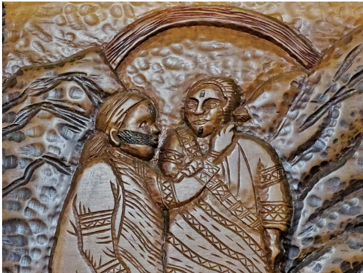
泰雅族Gaga相關之木雕。

絡的學習下，透過教案帶領學生探討原住民族在不同殖民政權下的歷史遭遇，能讓學生建立更全面的台灣史觀，反思主流社會的發展模式對少數族群造成的影響，也是推動歷史轉型正義的方式。