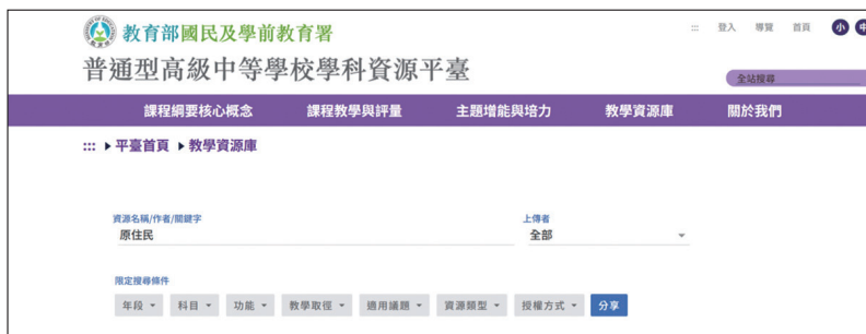
國教署普通型高級中等學校學科資源平台截圖。(https://ghresource.k12ea.gov.tw/nss/p/index)