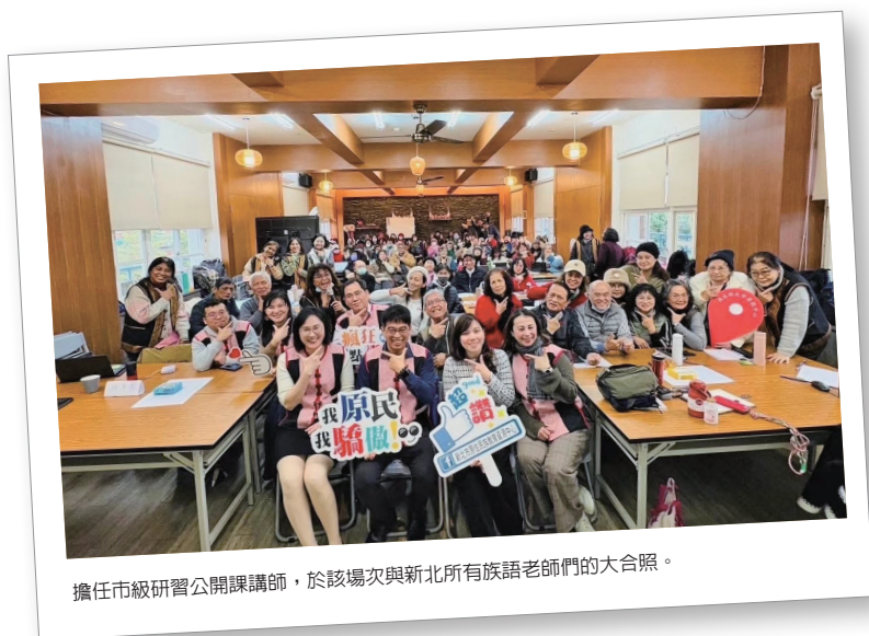
擔任市級研習公開課講師，於該場次與新北所有族語老師們的大合照。

這種人文與法理的碰撞，不僅解決了單一學科厚度不足的困境，更透過緊湊的節奏切換，引導學生在「感性同理」與「理性思辨」之間反覆橫跳，最終產出具備人文關懷與法學深度的跨域學習成果。此種跨族群的視角、跨領域的思辨，環繞著以賽德克族文化為核心的深度認識，共同交織成本案設計的核心底蘊，使國文科與公民科的對話得以在堅實的學科基礎上，開展出深邃的跨領域格局。