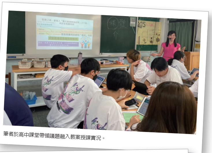
筆者於高中課堂帶領議題融入教案授課實況。

文學與法理的交織 ——跨領域協作之目的並非削弱國文學科本質，而是將文學蘊含的情感動能延伸至當代議題；此一嘗試不僅回應了108課綱跨領域議題融入的指標，更深化了文學在社會實踐層面的當代價值。因此，本課程在設計採取「先感性共感、後理性辯證」的設計：前三節課由國文學科主導，後三節課則由公民