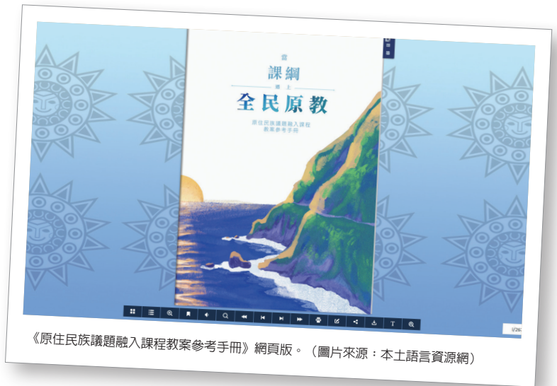
《原住民族議題融入課程教案參考手冊》網頁版。

的相關背景，我先是找了一些報導和網路文章給學生閱讀，讓學生知道目前贊同者與反對者主要的考量。而除了閱讀資料之外，我還提供學生一些思考的面向，例如：部落居民的生計、生活品質、遊客的心態、傳統文化保存與推廣。給予這些鷹架，是為了讓過去對這個議題毫無接觸的學生，也能凝聚出一些自己的想法，進而完成寫作任務。